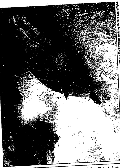
ROLAND BARBERS TRAINING AROUND SCIENCE

CHINOOK SALMON with no previous experience are able to navigate an arduous journey by a keen sense of Earth's magnetic fields. New research explains how.