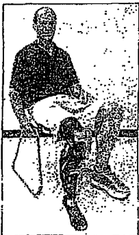
Rehabilitation Institute of Chicago THE PROSTHETIC

For the roughly 1 million Americans who have lost a leg or part of one due to injury or disease, Vawter and his robotic leg offer the hope that future prosthetics might return the feet of a natural gait, kicking a soccer (See Bionic, A7)