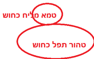
לרמ"א טהור נאסר כולו אם אין בו 60. משום 2 חומרות