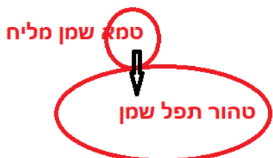
מין כ"ק. לרמ"א נאסר ב 60

וזה שלא כדברי הר"ן (שם) שכתב דג טהור שמלחו עם דג טמא מותר, לאו בנוגעים זה בזה עסקינן אלא שעומדים בסמוך בכדי שפליטה של זה נוגעת בזה, וכתב עוד טמא מליח וטהור תפל אסור משום דטמא מליח פולט ציר, וציר זה שהוא רותח מחמת מלח נבלע בטהור ואוסרו, ואף על פי שהטהור אינו מליח כל כך מחמת בליעתו שלא יהא נאכל מחמת מלחו, ולעיל אמרינן דלא אמרינן מליח הרי הוא כרותח אלא כשאינו נאכל מחמת מלחו, היינו לומר שאין הבשר רותח, אבל מכל מקום ציר זה הנופל עליו רותח הוא ונבלע בו, ומיהו הבשר צונן חשבינן ליה, דמשום הכי אמרינן טהור מליח וטמא תפל מותר, שאע"פ שנבלעים בתוכו טיפות רותחות מן הטהור, אעפ"כ אינו מתחמם כ"כ עד שיפלוט. סימן ע סעיף ג : "בשר שחווטה שמלחו עם בשר טריפה, או שהטריפה מלוחה והכשירה תפלה והם נוגעים זה בזה, אסור כדי קליפה. שאע"פ שאינו בולע מדם הטריפה, בולעת מצירה. אבל אם הכשירה מלוחה והטריפה תפלה, מותרת בהדחה בלא קליפה בין נתן כשירה למעלה, בין נתנה למטה. ויש מי שאוסר בנוגעים זה בזה, וסובר שלא הותרו אלא בעומדים בסמוך, בכדי שפליטה של זה נוגעת בזה. הגה: וכשהטריפה מלוח וכשר תפל, אפילו בכהאי גוונא אסור.