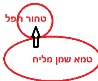
למין ולרמ"א נאסר ב 60